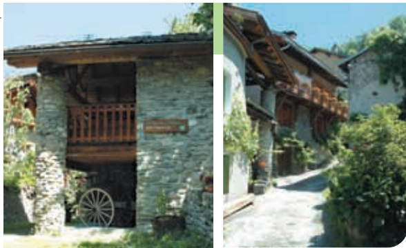
Maison de la Pomme