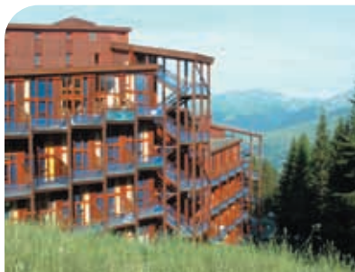
Aiguille Grive aux Arcs 1800