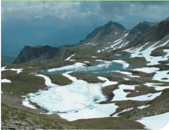
Les trois lacs au printemps