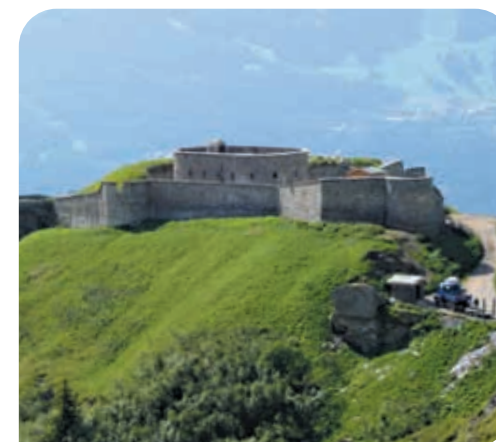
Fort de la Platte vu de dessus