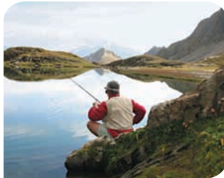
Pêcheur de truite des lacs

Le sentier d'accès longe nombre de ces zones humides, très sensibles au piétinement, véritables conservatoires génétiques, avec une flore (sphaignes, linaigrettes...) et une faune (grenouille rousse, triton alpestre) en équilibre depuis des millénaires.