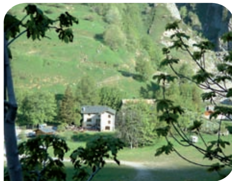
Refuge auberge de la Nova

À l'image du sentier du Tour du Mont Blanc, qui constitue d'ailleurs la « colonne vertébrale » du réseau de sentiers « Espace Mont Blanc », les innombrables chemins parcourant le massif ne connaissent pas les frontières.