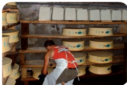
Cave à Beaufort

De nos jours, ce sont quelques 5 à 6000 moutons, dont certains originaires de Provence, une centaine de chèvres alpines chamoises et un grand nombre de vaches tarines et abondances qui passent l'été dans la vallée. Le lait est transformé sur place et le fromage, vendu chez le producteur.