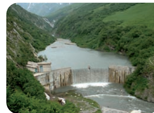
Barrage de Séloge

À partir de 1959, une grande partie des torrents descendant des sommets frontaliers sont aussi captés et canalisés. Depuis le Saint Claude et Mercuel de Sainte Foy en passant par le Reclus de Séez, le Versoyen descendant de la vallée des Veis, tous sont canalisés dans une conduite qui arrive au Chapieux. Mais le plateau des Chapieux est un point plus bas que la canalisation donc un long siphon remonte l'eau vers la galerie amont de Roselend.