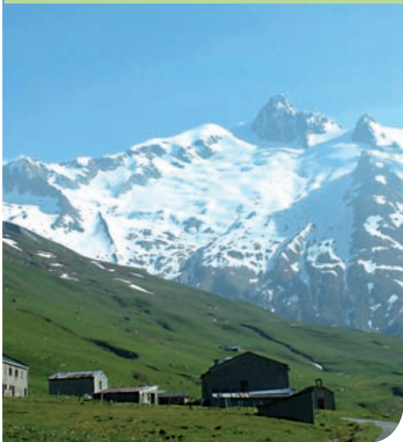
La ville et l'aiguille des glaciers