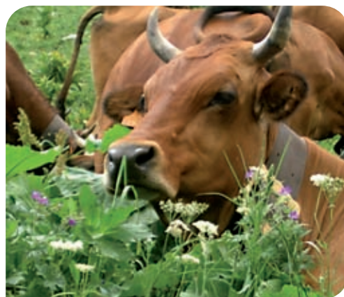
Tarines à l'alpage