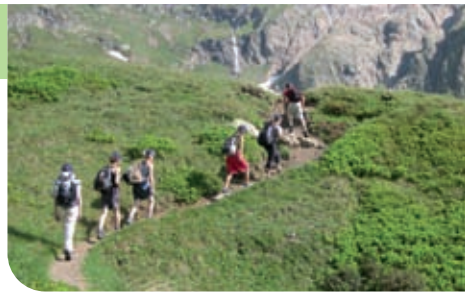
Randonneurs sous le refuge Robert Blanc

Ils ont toujours constitué des voies de passage pour des échanges de marchandises entre les vallées adjacentes. Contrebandiers, cristalliers et colporteurs ont jalonné les cols du Bonhomme et de la Seigne.