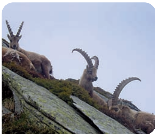
Bouquetins dans la falaise de Séloge